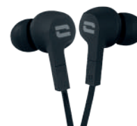
AURICOLARI IMPERMEABILI IPX6